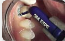
A 3M ESPE Retrakciós Paszta alkalmazása